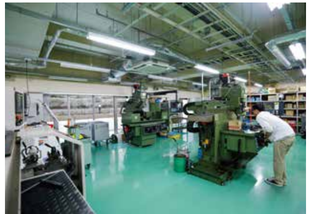
津田沼キャンパス（工作センター）