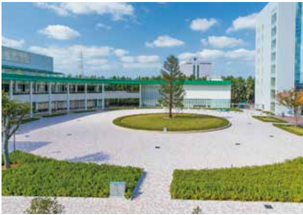
新習志野キャンパス（食堂棟）