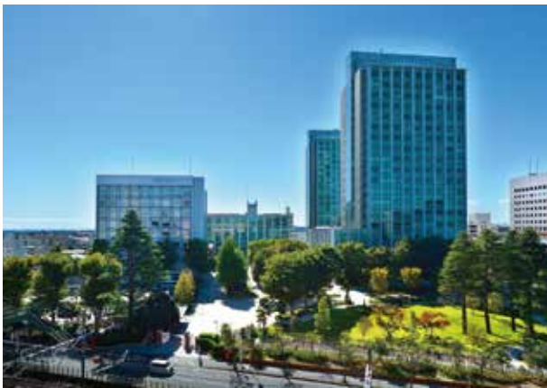
津田沼キャンパス