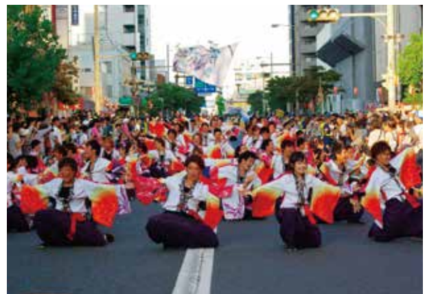
課外活動（よさこいソーラン風神部）