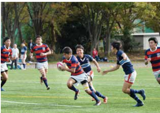
課外活動（ラグビー部）