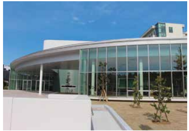
新習志野キャンパス（体育館）