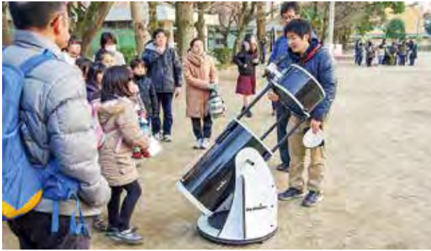
① 星座を学び早見盤作り ② 戸外で天体観測