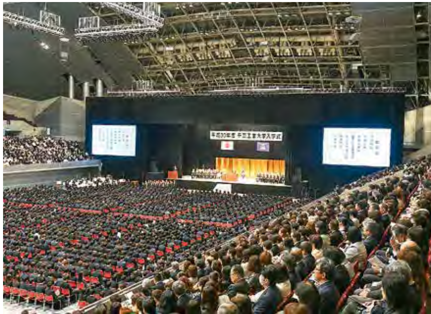
幕張メッセ・イベントホールで行われた入学式

が私の耳に留まりました。それは、大学受験に失敗して浪入し、「進学・勉強」に悩んでいる満男が「おじさん、何のために大学へ行くのかなあ