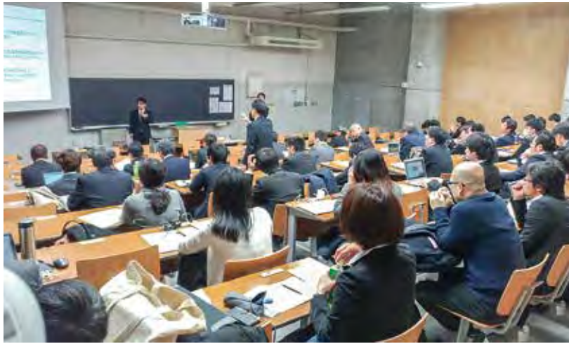
新習志野キャンパスで開かれた講演大会