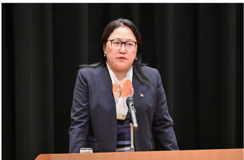
講演するドルマ大臣と、会場を埋めた学生・教職員たち

本学が新たに展開する「情報変革科学部」は、最先端のサイバー・フィジカル社会を支えるよう、基板技術・応用技術についてハード、ソフトの両面からアプローチし、変化の激しい世界でのICT(情報通信技術)を設計開発できる人材を育成する。そのために、次の環境を重視し、準備を進めている。 ● 教育環境整備 通信容量の拡大が必要となることから、それに