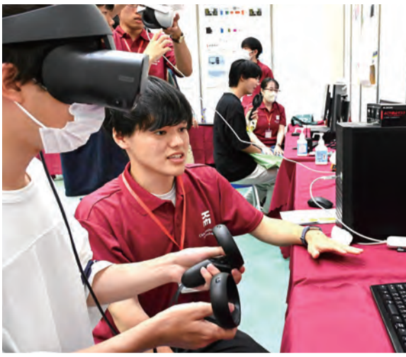
学び体験・来春新設される認知情報科学科