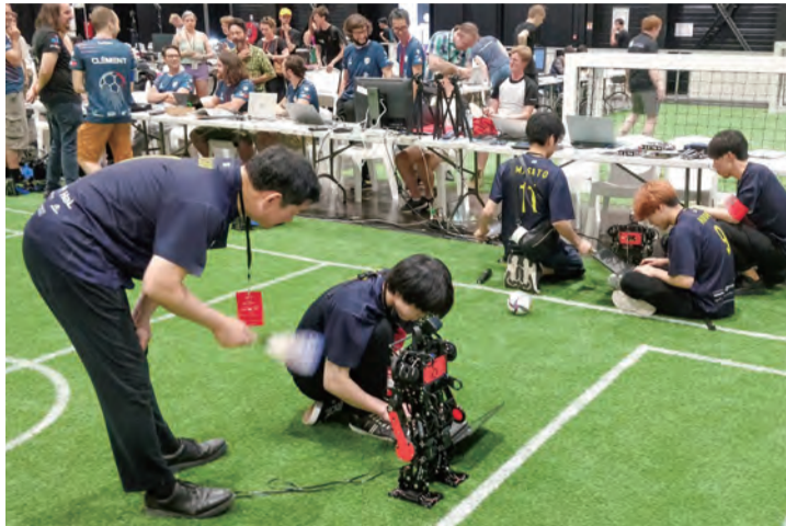
① 人型自律ロボットを調整するメンバーたち ② 来年へ闘志を燃やすCIT Brainsチーム

自律型ロボットによるサッカーの世界大会「ロボカップ2023」が7月4〜10日、フランス南西部ポルドーのエキシビジョンセンターで開催され、本学チーム「CIT Brains」がヒューマノイドリーグ・キッドサイズ部門（4機対4機）で準優勝した。4チーム同士が合同で戦い得点を競う「ドロップイン」でも準優勝。技術力を競う「テクニカルチャレンジ」では3位入賞を果たし、千葉工大の高い技術力を改めて世界に示した。