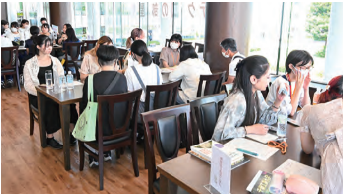
チバテクコの部屋

学科別総合型選抜説明会では、間近に迫った総合型入試対策が説明され、熱心にメモを取る姿が見られた。体育館では全17学科が「学び体験」を展開。研究内容を分かりやすく紹介しようと展示物や体験授業を工夫し、各学科の魅力アピールした。