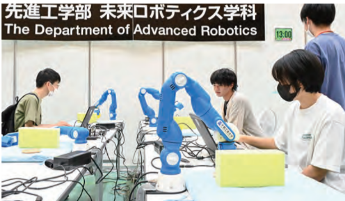
先進工学部 未来ロボティクス学科 The Department of Advanced Robotics