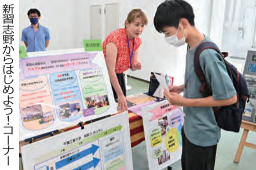
新習志野からはじめよう! コーナー

「(一般)」と「学部学科全体説明会」とともに続々と満席になったため2次開場を増設して対応。高校生らは千葉工大の特色や入試を詳しく知ろうと詰めかけ、立ち見姿も多く見られた。