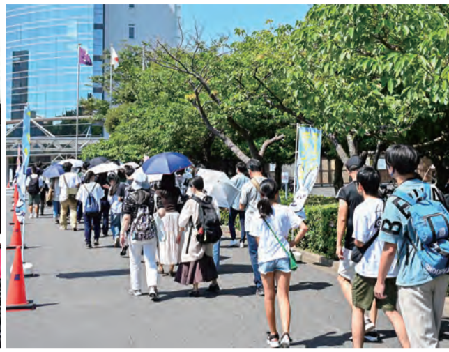
朝早くから大勢の来場者が並んだ